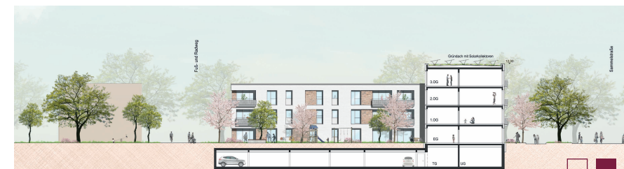
Schnitt Ost-West Baufeld G3 1:200