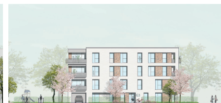
Ansicht West Baufeld G3 1:200