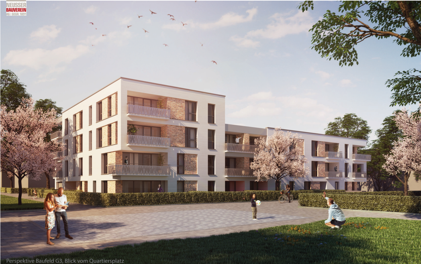
Perspektive Baufeld G3, Blick vom Quartiersplatz