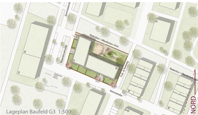
Lageplan Baufeld G3 1:500