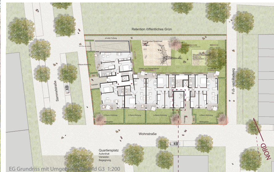
EG Grundriss mit Umgebung Baufeld G3 1:200