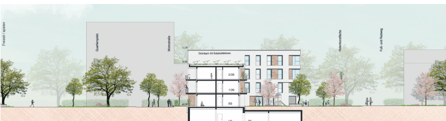
Schnitt Nord-Süd Baufeld G3 1:200