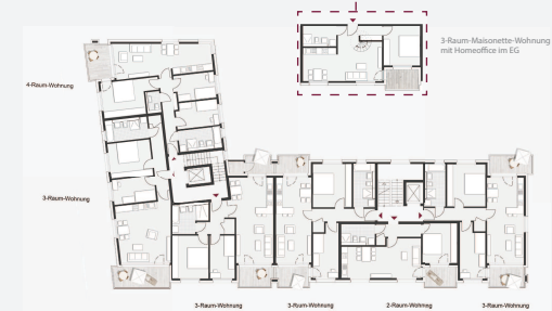
Grundriss OG Baufeld G3 1:200