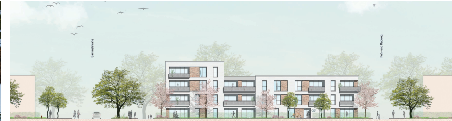
Ansicht Süd Baufeld G3 1:200